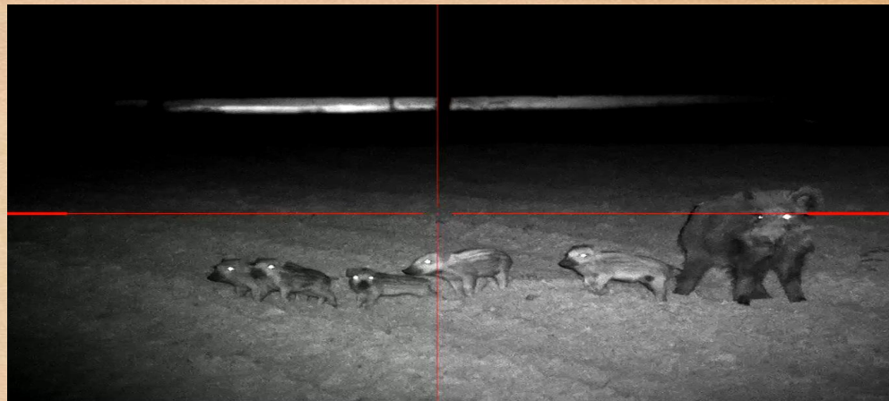
Locha z pasiakami